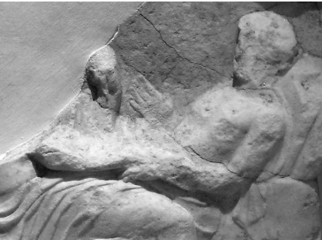
Fig. 3 – Relief fragmentaire provenant de l'Asklépieion d'Athènes, IV e siècle avant J.-C., avec détail (Athènes MN 1841)

de l'incubation. À gauche, deux personnages drapés de petit format, avant-bras droit levé, semblent assister à la scène. Leur taille les oppose aux figures divines et l'on peut identifier un homme et une femme : la présence récurrente de fidèles en prière souligne la relation qui s'établit entre la demande qui est faite au dieu et la guérison obtenue. À droite, une figure masculine de grande taille, torse nu, accoudée au pilastre, étend la main droite au-dessus du malade allongé. La différence de taille avec les individus sur la gauche invite à y voir une divinité. Le geste de la main droite pose quelques difficultés de lecture : les doigts sont bien dessinés, la fermeté