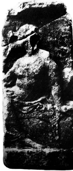
Fig. 4 – Relief fragmentaire provenant de l’Amphiaraiion d’Orôpos, début du IV e siècle (Musée du Pirée, sans n o inv. )

avec sa main ; là-dessus un garçon d’Arrybas était à Andromakhè » 45 . Une forme analogue de représentation de l’intervention du dieu apparaît sur le fragment du relief qu’il faut attribuer à un registre onirique.