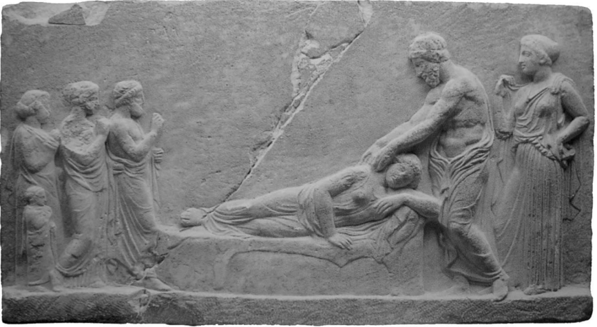
Fig. 1 – Relief fragmentaire provenant de l’Asklépieion du Pirée, fin du V e -début du IV e siècle avant J.-C. (Musée du Pirée, 405)

de paradigme à la série des reliefs votifs relatifs à l’incubation 8 . Fabriqué en marbre pentélique, le relief comporte une image dans laquelle on peut distinguer trois parties. Au centre, est représentée une femme allongée sur une klinè ; faisant face au spectateur, elle repose sur le côté gauche, le bras gauche replié sur un coussin reposant sur la tête du lit, la main droite tenant le rebord de la klinè . Elle porte un khitôn et un manteau dont le bord inférieur retombe le long du coussin. La klinè est recouverte d’une peau d’animal dont les deux pattes touchent le sol. À droite, un personnage barbu, dont la grande taille signale qu’il s’agit d’un dieu, approche ses deux mains du cou de la femme ou de l’épaule droite; à l’arrière, une déesse se tient debout, le bras droit levé tenant un pan de son péplos . Tout, vu le contexte, laisse à penser que ce sont Asklépios et Hygie. À gauche, quatre individus, de taille plus petite que les divinités, se tiennent debout, avec le bras droit levé (geste d’orant); on peut identifier un vieil homme (avec barbe), une femme, suivie d’une autre femme drapée dans son manteau à côté de laquelle se trouve un enfant.