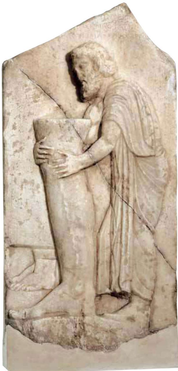
Ex-voto au dieu Asclépios, relief en marbre, V e siècle av. J.-C. provenant du sanctuaire d'Épidaure. Musée archéologique d'Athènes.

Une des stèles de guérison indique également qu'un « des chiens sacrés » ( kyôn tôn hiarôn ) parvient à soigner un jeune garçon d'Égine qui avait une protubérance au cou. Il ne s'agit pas ici d'un rêve, puisqu'il est bien précisé que l'enfant est « éveillé ». Le sanctuaire devait donc avoir son propre élevage de chiens. Les serpents, nous l'avons vu, sont fortement associés à la figure d'Asclépios. En visitant Épidaure, Pausanias (II, 28) s'étonne que « tous les serpents [...] soient consacrés à Asclépios et soient complètement inoffensifs pour les hommes ». La statue du dieu le représente d'ailleurs touchant la tête d'un serpent. Ces animaux sont utilisés dans différents cas de guérison,