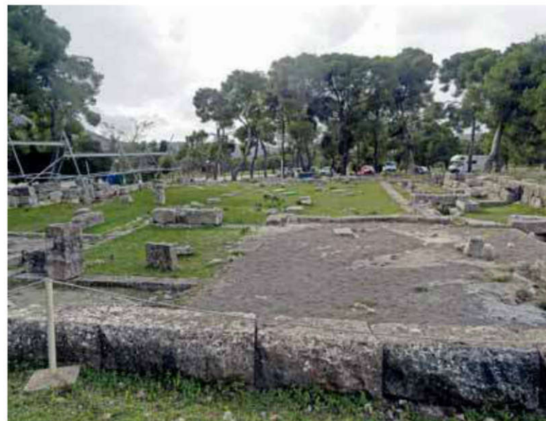
Bains grecs du sanctuaire d'Épidaure.

Les interdits du sanctuaire d'Asclépios selon Pausanias (II, 27, 1) : « Le bois sacré d'Asclépios est entouré de montagnes de tout côté. On ne peut ni mourir, ni accoucher à l'intérieur de l'enceinte sacrée (peribolos) : on trouve une restriction (nomon) semblable dans l'île de Délos. Ce qui est offert en sacrifice (thuomena), que ce soit un étranger ou un Épidaurien qui fasse le sacrifice, doit être consommé à l'intérieur des limites sacrées (entos tôn horôn). »