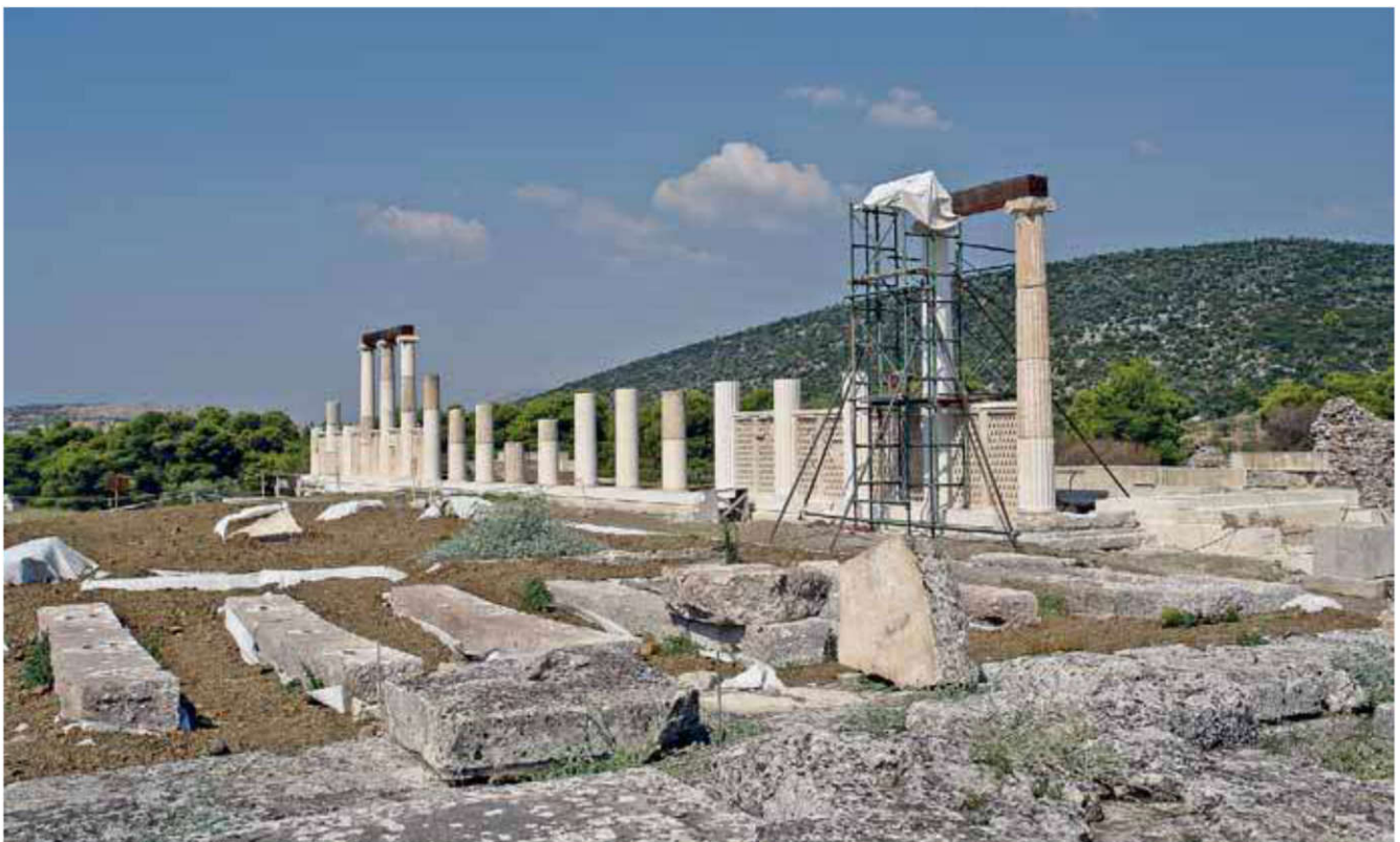
Abaton, portique d'incubation dans le sanctuaire d'Épidaure, anastylose.

pas préparés à « recevoir » Asclépios, c'est-à-dire ceux qui n'ont pas accompli les étapes précédentes. La source sacrée d'Asclépios, qui est incluse dans la stoa , du côté nord-est, permet en partie cette purification : c'est à cet endroit que se trouvent les iamata , de sorte que les patients peuvent les lire pendant leurs préparatifs et se mettre dans un état d'esprit semblable.