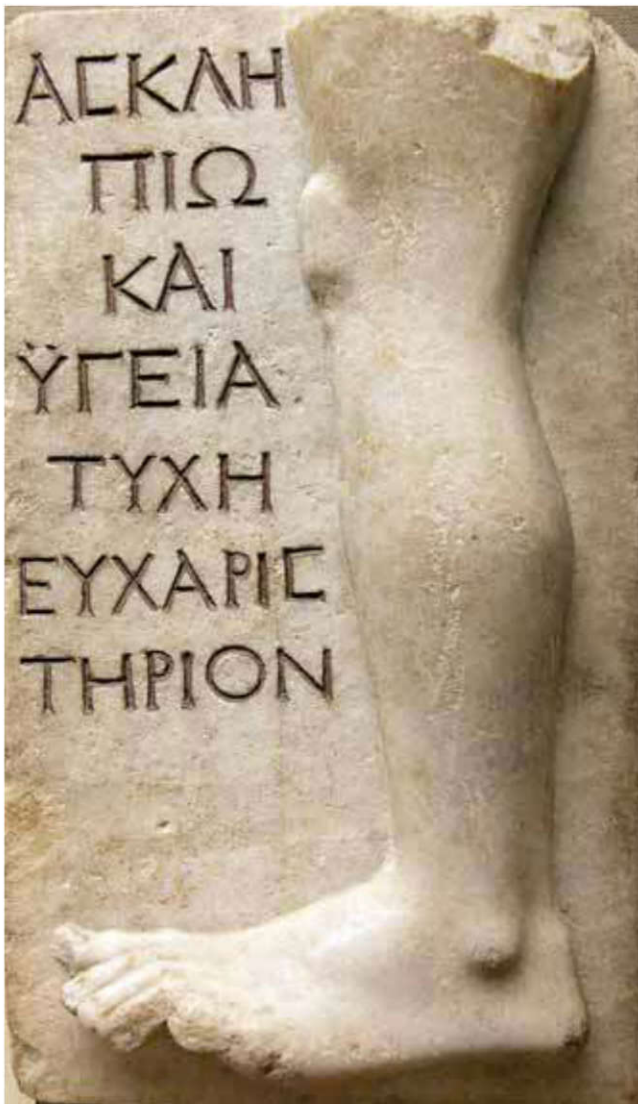
Relief votif offert pour la guérison d'une jambe malade. Découvert en 1828 dans le même sanctuaire de l'île de Milos, en mer Égée, que la tête d'Asclépios (voir article : Le héros Asclépios ) ; vers 100-200 apr. J.-C. British museum, Londres.

suppliante à Épidaure, rit devant les stèles de guérison, les jugeant improbables. Asclépios lui apparaît en rêve et lui enjoint de consacrer, une fois guérie, un cochon d'argent « comme souvenir (hypomnema) de son ignorance ».