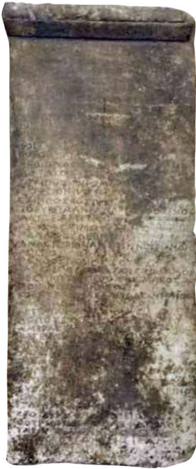
Stèle des théarodoques (IG IV 2 I. 94/95), 365-311 av. J.-C.