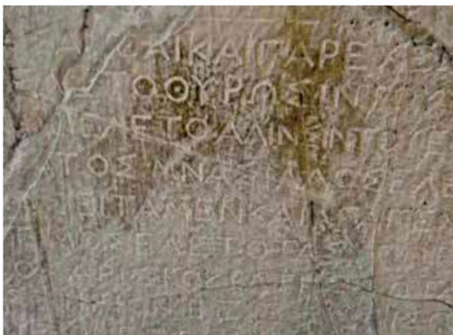
Comptes de construction du sanctuaire (IG IV 1. 110).