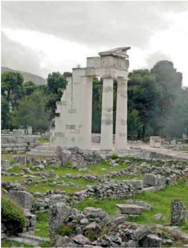
Propylon, entrée de l' hestiatorion (gymnase) du sanctuaire d'Asclépios.

À partir du VI e siècle av. J.-C., Apollon Maléatas se trouve associé à son fils, Asclépios, et les deux coexistent en bons termes jusqu'à l'époque romaine où ils apparaissent ensemble sur des inscriptions. Les Épidauriens construisent d'ailleurs en son honneur un temple de style dorique au IV e siècle av. J.-C. Le culte se concentre alors surtout autour de la figure d'Asclépios, mais son père divin n'est jamais oublié.