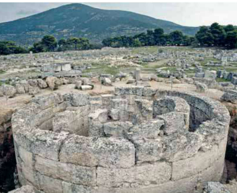
Tholos, sanctuaire d'Épidaure, IV e siècle av. J.-C.

façade), qui mesurait 13,50 x 9,60 m. L'édifice était en tuf avec certaines parties en marbre comme la toiture, des Victoires ornant le fronton est.