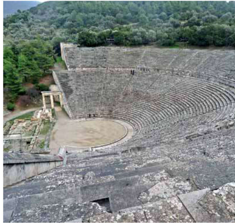
Théâtre, sanctuaire d'Épidaure.

« Les Épidauriens possèdent également un théâtre dans l'enceinte sacrée, qui, me semble-t-il, est un des plus admirables. Les théâtres des Romains dépassent certes en beauté ceux de toutes les autres régions du monde, et celui des Arcadiens à Mégalopolis surpasse les autres par sa taille. Mais, si l'on se concentre sur l'harmonie et la beauté, quel architecte oserait se comparer à Polyclète ? Car c'est bien Polyclète lui-même qui a construit ce théâtre et qui est le créateur du bâtiment rond [tholos] » (Pausanias, II, 27).