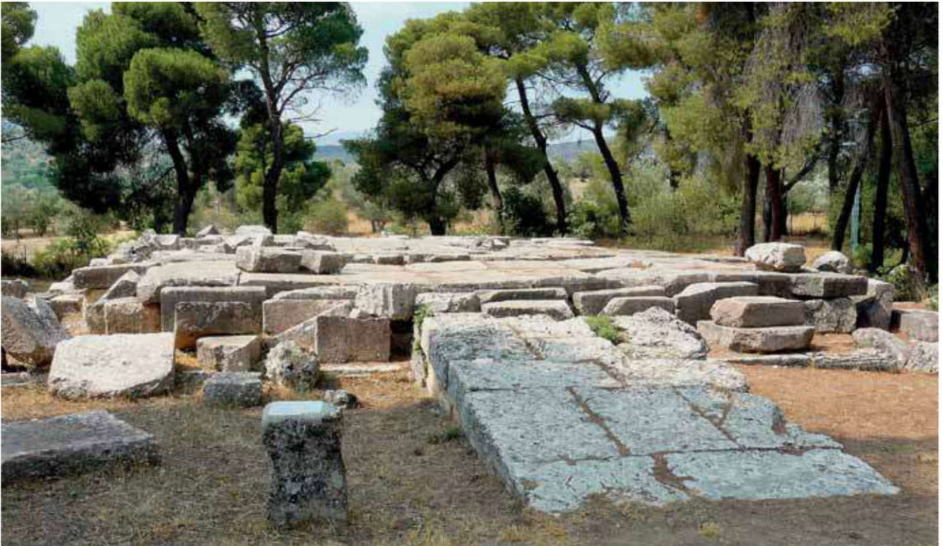
Les Propylées, entrée principale du sanctuaire d'Asclépios à Épidaure, Grèce. GFDL.

« Entre l'isthme et le Skyllaion sont les Épidauriens, renommés pour leur temple d'Asclépios ». Ainsi s'exprime le géographe du I er siècle apr. J.-C. Pomponius Méla (II, 3). La cité d'Épidaure est, en effet, avant tout renommée dans l'Antiquité comme possédant un des plus importants sanctuaires dédiés au dieu de la Médecine. Ce dernier prend une ascendance croissante à partir du IV e siècle av. J.-C., et devient un véritable lieu de pèlerinage panhellénique , de sorte que, dès l'époque hellénistique, ville et sanctuaire ne font plus qu'un dans l'imaginaire collectif, comme en témoignent les monnaies de la cité représentant Asclépios.