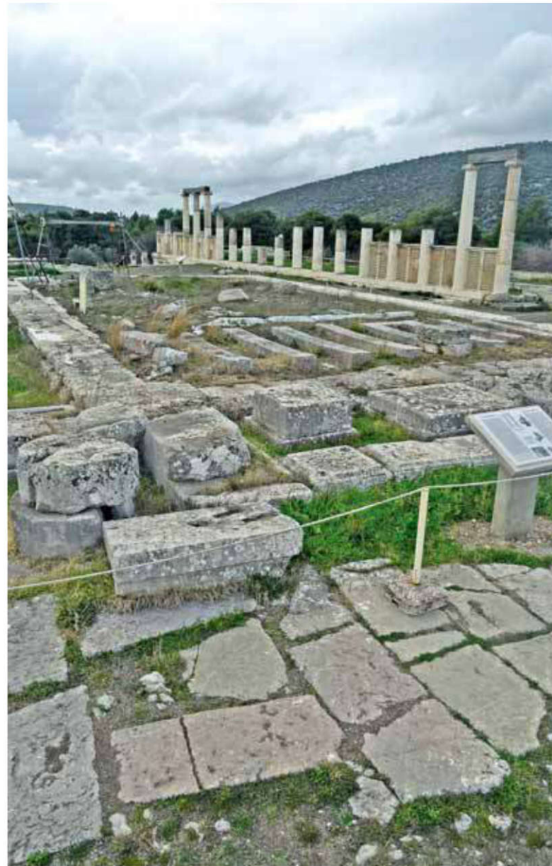
Temple d'Asclépios, Épidaure. © Clémence Weber-Pallez.